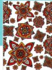
Preis des Präsidenten der Kyoto corporate federation of dyers and colorists Entwurf: Fernandes Peres