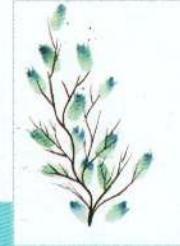
Preis des Präsidenten der Japan Textile Dyeing Joint Association Entwurf: Tessa M. de Graaf