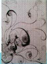
Preis der Gouverneure von Kyoto Entwurf: Olga Tonkha

Bei dem diesjährigen Wettbewerb für die Gestaltung von Kimono-Stoffmustern wurden folgende Entwürfe ausgezeichnet. Herzlichen Glückwunsch an die Gewinner!