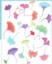
Preis des Präsidenten der Kyoto corporate federation of dyers and colorists Entwurf: Sabrina Tölbirt