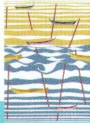
Preis des Präsidenten von Japan Cultural Exchange (UCE) Entwurf: Tatiana Cardoso da Silva