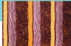
Preis des Präsidenten der Kyoto corporate federation of dyers and colorists Entwurf: Marlies Raasch